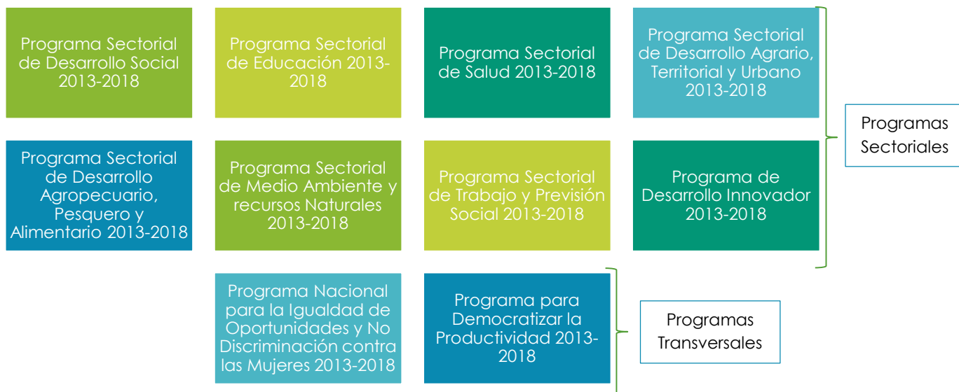
Figura 1. Programas derivados del PND 2013-2018 evaluados

Con el objeto de contar con información sobre la política de desarrollo el Consejo determinó la evaluación a diez Programas derivados del PND: ocho Programas Sectoriales, operados por las dependencias del sector social que tienen mayores recursos asignados, y dos Programas Transversales (ver figura 1). Los objetivos sectoriales son atendidos a través de los Programas Sectoriales que tienen a cargo las dependencias de la APF; mientras que estrategias transversales establecidas en el PND se promueven como componentes transversales dentro de las políticas públicas pertinentes a la problemática que atiende. Una acción transversal, a diferencia de una acción sectorial, corresponde a la atención de una problemática global que, dada la naturaleza compleja de esta problemática, requiere de esfuerzos intersectoriales coordinados para su solución.