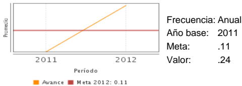
Promedio de proyectos de investigación y desarrollo tecnológico realizados, relacionados con los proyectos apoyados.

El indicador de Fin (Posición que ocupa México en la variable Calidad de las instituciones de investigación científica del IGC) superó su meta, pues alcanzó el lugar 49 en lugar del 52. Los indicadores de Propósito, promedio de proyectos de investigación y desarrollo tecnológico realizados relacionados con los proyectos apoyados y promedio de recursos humanos de alto nivel formados relacionados con los proyectos apoyados, superaron sus metas en 54% y 53% respectivamente. Sin embargo esos resultados se deben tomar con reservas por dos razones: el resultado del indicador de Fin no depende exclusivamente de las acciones del programa y la falta de criterios explícitos para definir las metas de los indicadores, pues sin ellos es imposible determinar si el que el programa haya superado sus metas se debe a su buen desempeño, o a la laxitud de las metas. En la EED 2010-2011 se señaló, acertadamente, el problema que tiene el indicador a utilizado nivel de Fin para medir los efectos del programa. En el Informe de Autoevaluación presentado a la Junta de Gobierno del CONACYT, se señalaron los avances obtenidos en la materia durante el periodo de enero-diciembre de 2012. Sin embargo, éstos parecen ser logros del CONACYT y no resultados directos del programa.