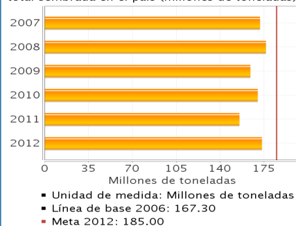
Indicador Sectorial Producción agrícola de los 50 productos principales que representan el 85% de la superficie total sembrada en el país (millones de toneladas).