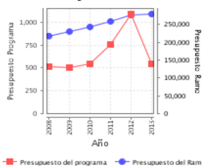
Presupuesto Ejercido Programa vs. Ramo