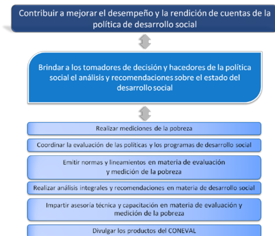
Figura 2. Esquema de planeación institucional

Es importante señalar que, a fin de tener congruencia entre los distintos instrumentos de planeación y monitoreo del Consejo, el esquema descrito parte de la MIR del CONEVAL, en sus distintos niveles; los indicadores aquí mostrados son los que se incluyen en ella.