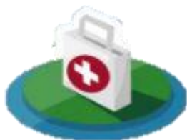
Servicios de Salud