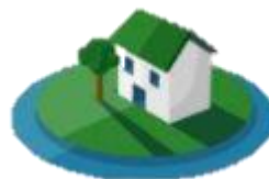
Calidad y espacios en la vivienda