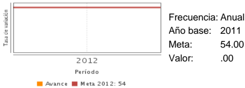
Tasa de crecimiento de los Grupos indígenas organizados que reciben ingresos económicos - turistas en la administración de sus sitios turísticos