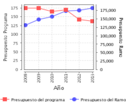
Presupuesto Ejercido Programa vs. Ramo