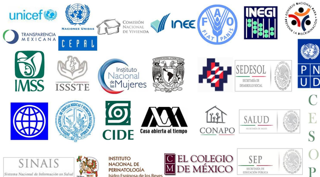
Figura 2. Instituciones y organismos consultados y que participaron en la construcción de la metodología de medición de pobreza multidimensional

La participación activa de las y los investigadores académicos del CONEVAL enriqueció el contenido de la metodología, tanto por el constante impulso para la adopción de un programa de investigación riguroso, como por la riqueza de enfoques y perspectivas que cada uno de ellos aportó para su desarrollo.