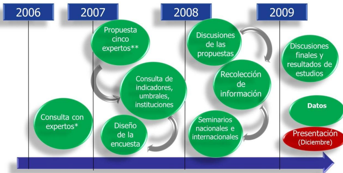
Figura 1. Cronología de la construcción de la metodología de medición de pobreza multidimensional

* Boltvinik, Bourguignon, De la Torre, Kakwani, Khander, Lustig, Skoufias y Walton, entre otros.