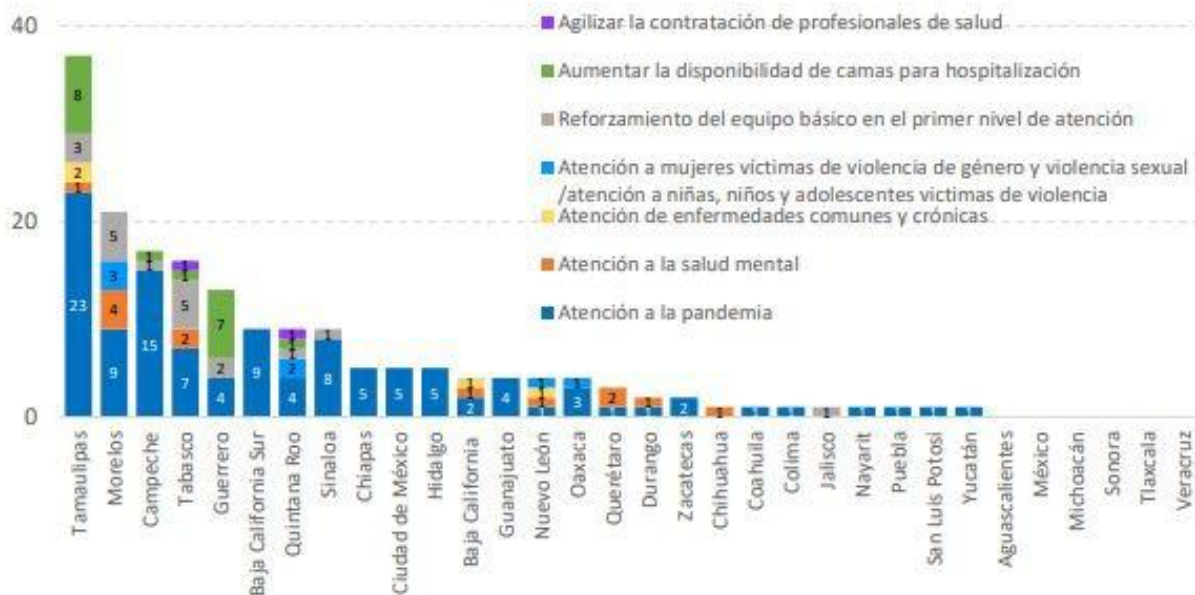
CONEVAL Número de programas y acciones relacionadas con el derecho a la salud por entidad federativa