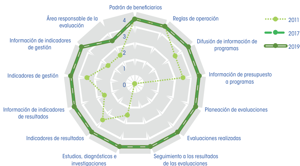
Gráfica 3. Cambio en el componente práctico, Guanajuato, 2011, 2017 y 2019