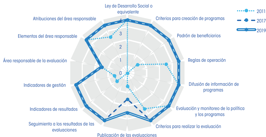
Gráfica 2. Cambio en el componente normativo, Guanajuato, 2011, 2017 y 2019